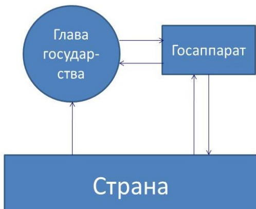
Рис. 2. Государственное управление при отсутствии профессионального блока концептуальной (жреческой) власти

Потом власти только над Египтом иерофантам показалось мало, и они породили библейский проект