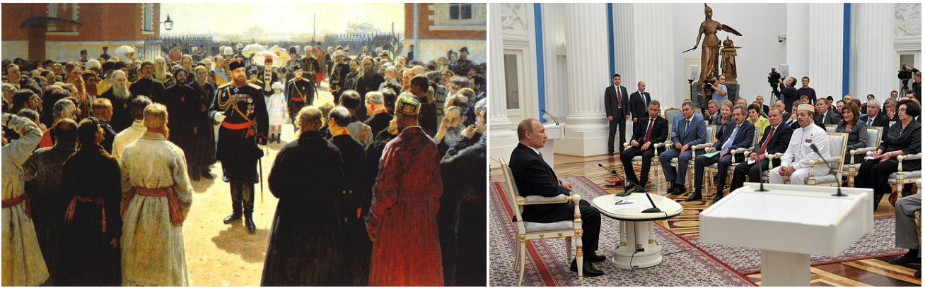
1 См. сноску внизу страницы.

Пока же государственная власть России «балаганит» на тему «кто придумает консолидирующую идею?», — приверженцы буржуазно-либеральной идеи (при реализации которой госчиновники — всего лишь наёмники глобальной корпорации ростовщиков, ответственные перед ними) «бодаются» с приверженцами идеи «элитарно»-чиновничьего государства в борьбе за власть над Россией с целью эксплуатации её природных и людских ресурсов 2 .