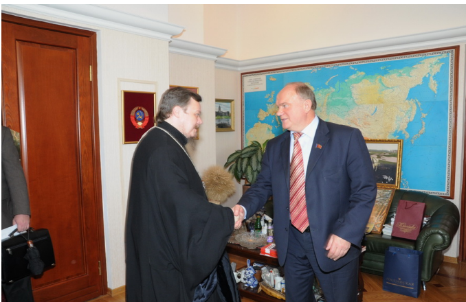
Дух Бендера витает над ними: Почём будем торговать «опиум для народа»?

В свою очередь присутствовавший на заседании премьер-министр РФ Владимир Путин согласился с высказыванием отца Всеволода, но при этом заметил: «Вы сказали, что справедливость имеет ещё и ярко выраженный социальный смысл. Вопрос такой: всем поровну — это справедливо?»