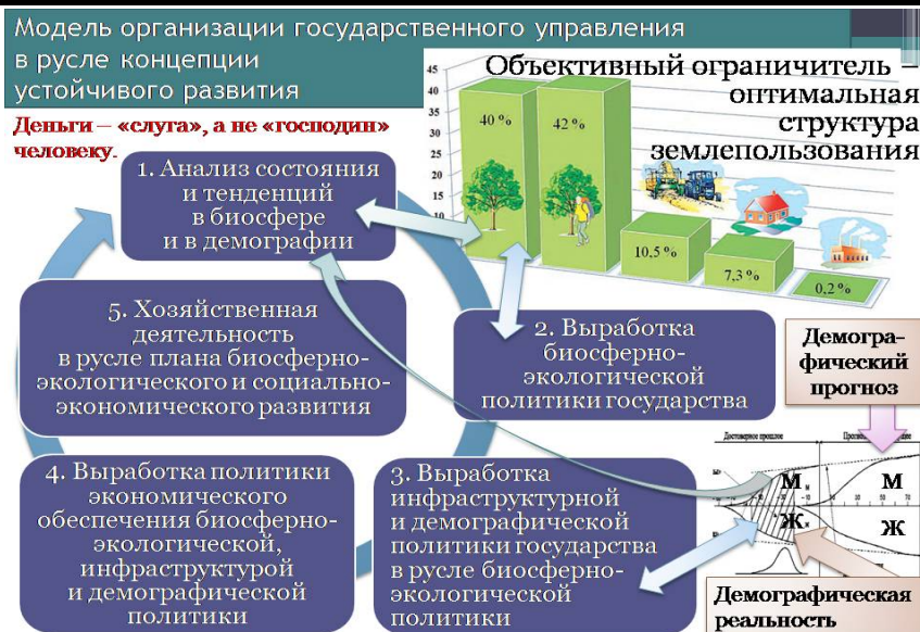
Рис. 1. Взаимная обусловленность частных управленческих задач в ходе реализации концепции устойчивого развития.

то следование ей в практической политике в принципе позволяет реализовать государственное управление в соответствии с объективно необходимой циклической постановкой и решением задач общественного устойчивого развития в гармонии с Природой и обеспечить военно-экономическую безопасность общества и государства: см. рис. 1 и пояснения к нему в Приложении.