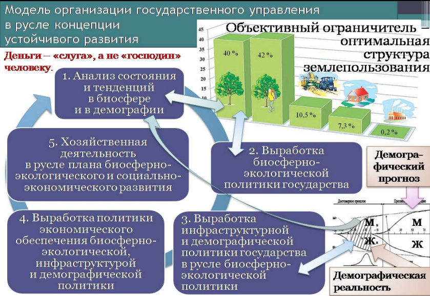
Рис. 1. Взаимная обусловленность частных управленческих задач в ходе реализации концепции устойчивого развития.

лежать в русле всех упомянутых ранее объективных закономерностей, следование которым гарантирует устойчиво бескризисное развитие общества (биосферным, биологическим видовым, этическим, экономическим, социокультурным, управленческим). И если идти от совести ко всем аспектам жизни общества и личности, то никаких противоречий между диктатурой совести и диктатурой закона быть не может, поскольку в этом случае: во-первых, в законодательстве выражается текущее понимание в обществе историко-политической справедливо-