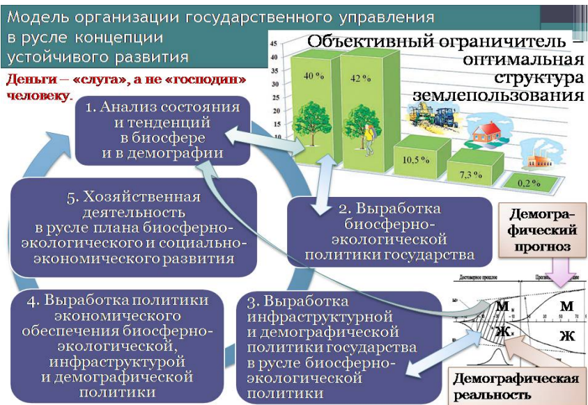
Рис. 1. Взаимная обусловленность частных управленческих задач в ходе реализации концепции устойчивого развития.

Рис.1 в разделе 2.2 представляет зримо алгоритмику государственного управления, лежащую в русле изложенного выше подхода.